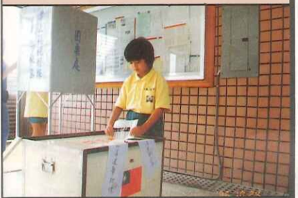
●好興奮、第一次投票吧！