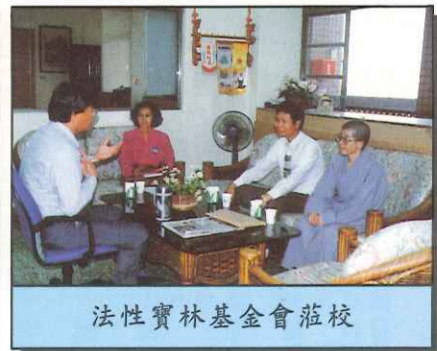
法性寶林基金會蒞校