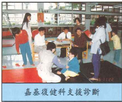
嘉基復健科支援診斷