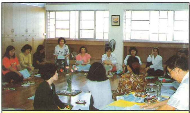
輔導室—家長成長團活動