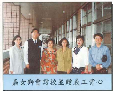
嘉女獅會訪校並贈義工背心