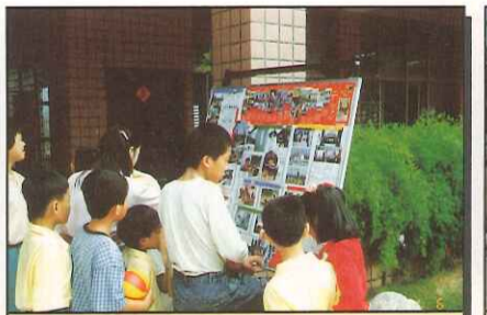
輔導室協辦行前教學活動