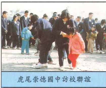
虎尾崇德國中訪校聯誼