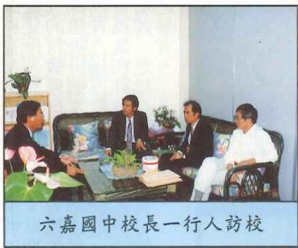
六嘉國中校長一行人訪校