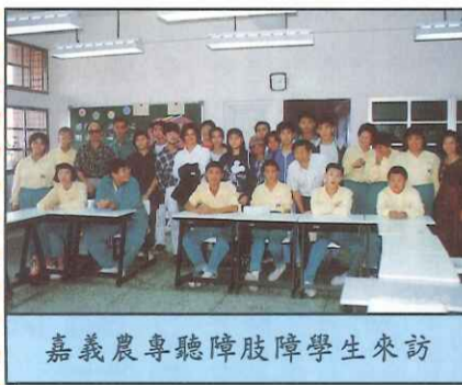
嘉義農專聽障肢障學生來訪