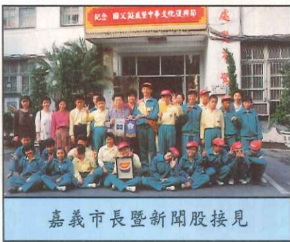
嘉義市長暨新聞股接見