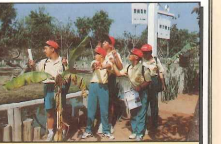
嘿！人猿比老師的鏡頭有魅力哦