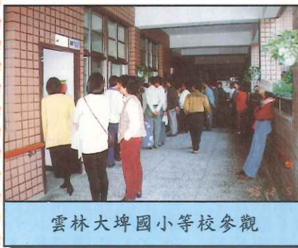
雲林大埤國小等校參觀